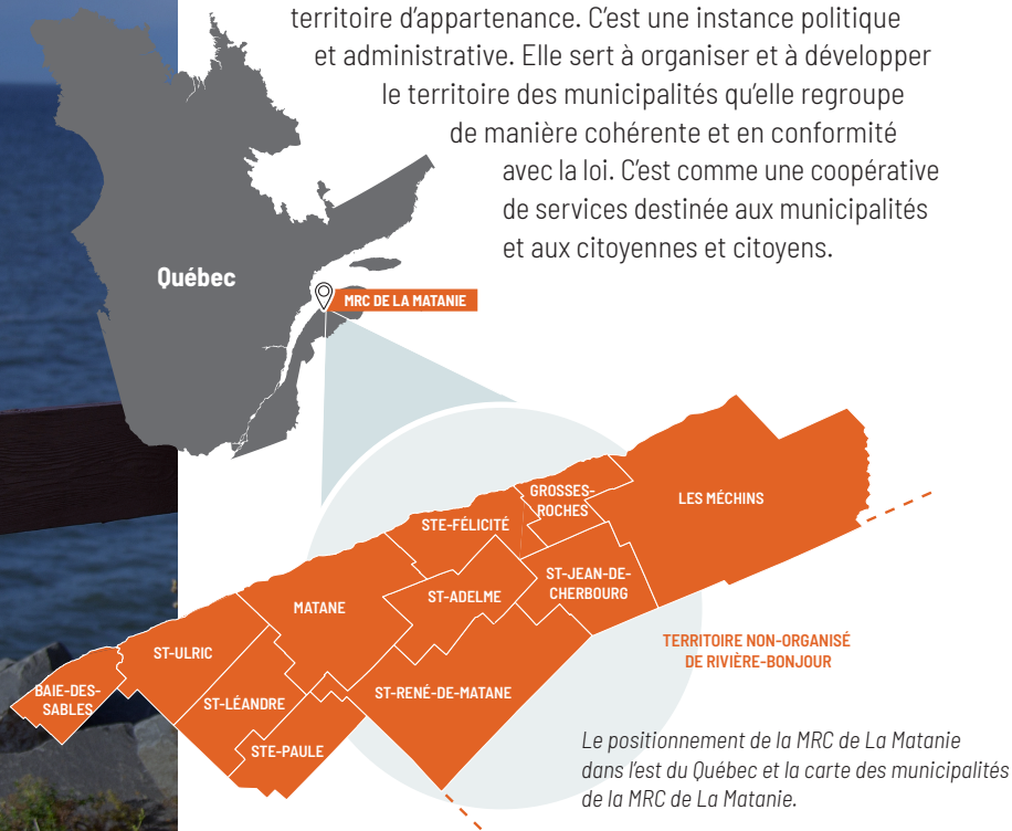
Le positionnement de la MRC de La Matanie dans l'est du Québec et la carte des municipalités de la MRC de La Matanie.

Une MRC est un ensemble de municipalités ayant un même territoire d'appartenance. C'est une instance politique et administrative. Elle sert à organiser et à développer le territoire des municipalités qu'elle regroupe de manière cohérente et en conformité avec la loi. C'est comme une coopérative de services destinée aux municipalités et aux citoyennes et citoyens.